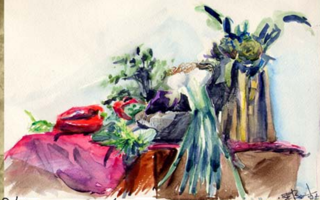
Nature morte. Aquarelle sur papier blanc 1987

Cette aquarelle a une histoire. Dans les années 90 je suis allé dans une galerie Corse. Avec ma 'prestancie' de cet te époque, je suis allé rencontrer non pas le galeriste mais l'inté riateur de ce vieil établissement: un très vieux peintre connu du coin. Après avoir regardé mon carton à dessin, il me sort cette aquarelle du lot et me dit: "tout ça est un peu jeune et confus, la seule que je trouve bonne est celle-ci (ndla: l'aquarelle ci-dessus)! Celle-là je veux bien vous l'acheter pour l'exposer". Le problème est que je ne vends pas mes aquarelles. C'est donc sur cet autel que mes oeuvres sur la Corse ont séché et sont parties à jamais dans l'oubli de mon carton à dessin.