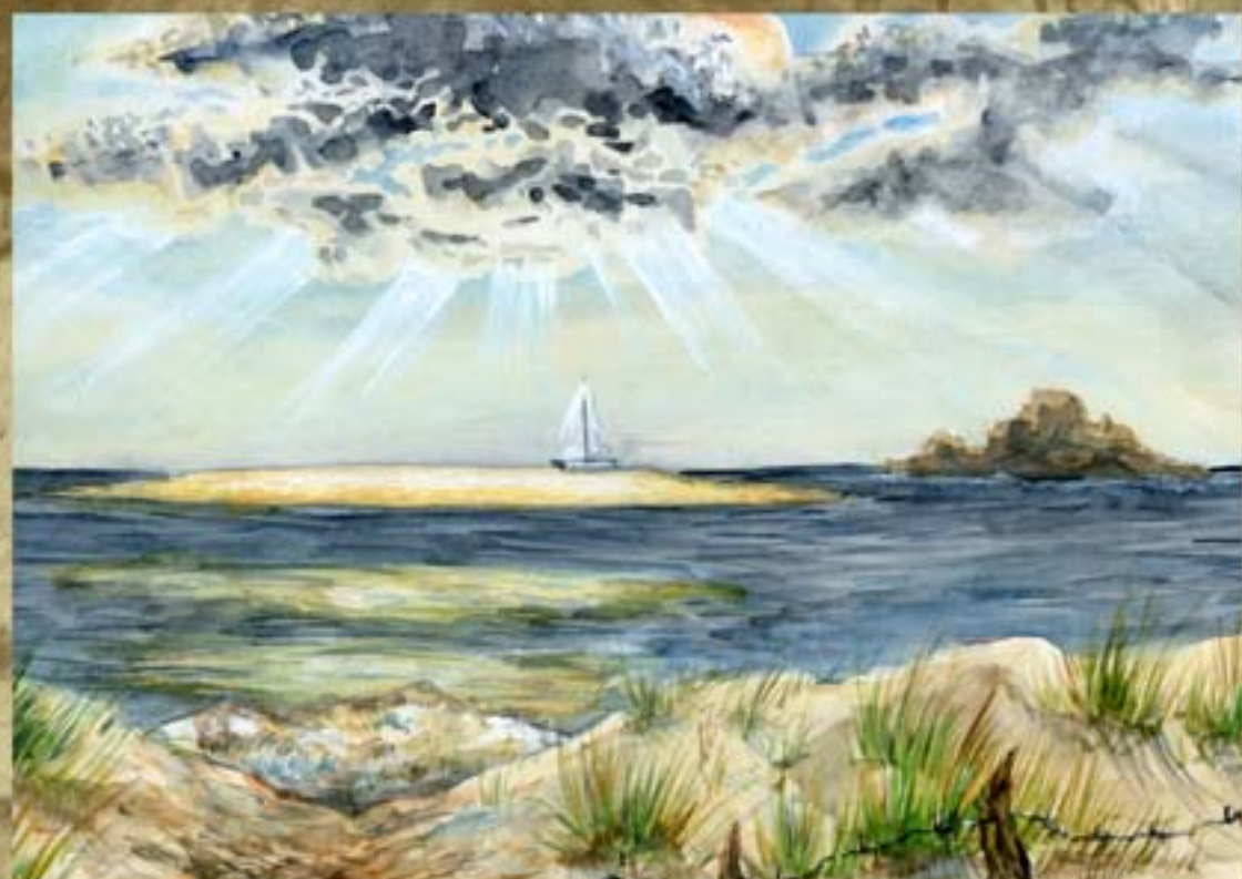
Lumière sur Capo di Ferro (Corse). Aquarelle sur papier blanc 1987