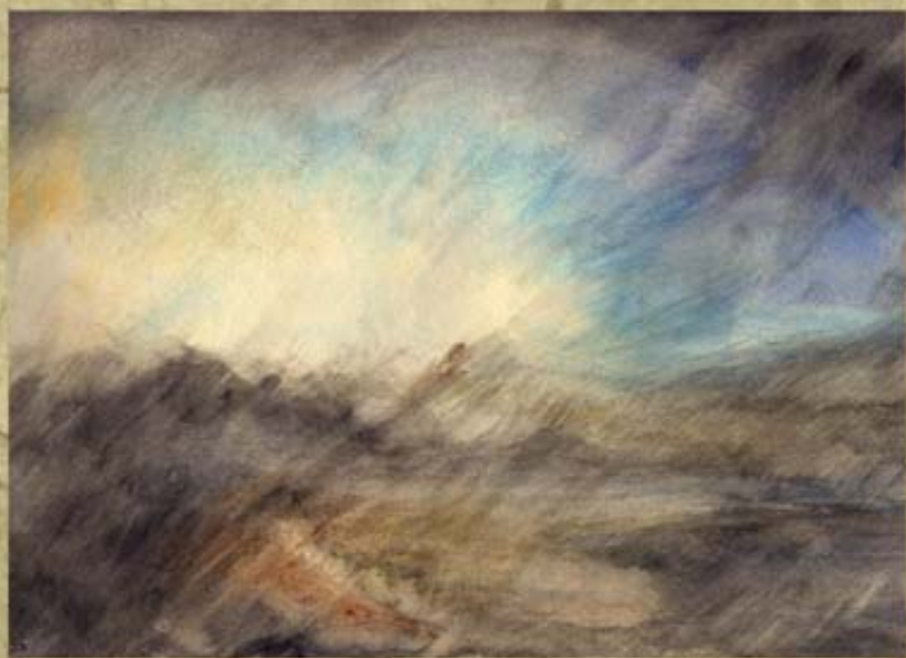
Paysage imaginaire façon Turner. Aquarelle sur papier blanc 1988

A cette époque il n'y avait pas le net avec la facilité de découvrir l'oeuvre d'un peintre, même un inconnu. Et les livres sur ce grand Artiste étaient confidentiels. Les quelques images trouvées dans les livres ne me permettaient pas d'avoir un avis, jusqu'au jour où à la fin dans une fin de série je trouvai un livre sur Turner. Quand je l'ai ouvert, ce fut comme quand on hume le parfum d'un grand vin. Tout était là pour le plaisir intense de mes yeux et de mon âme.