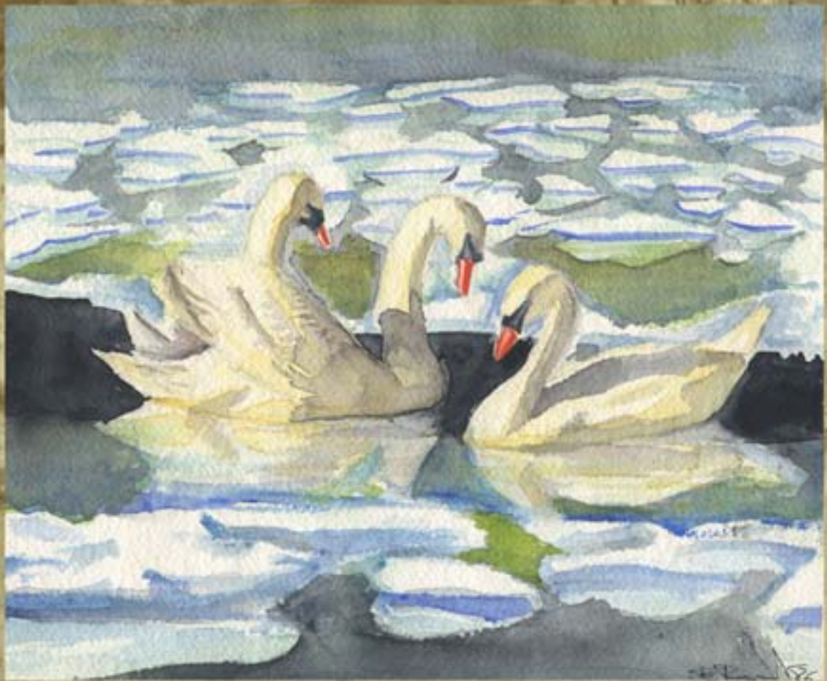
Cygnés sur le lac gelé. Aquarelle sur papier blanc 1986