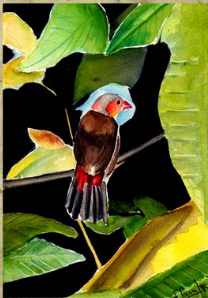
Oiseau sur sa branche. Aquarelle sur