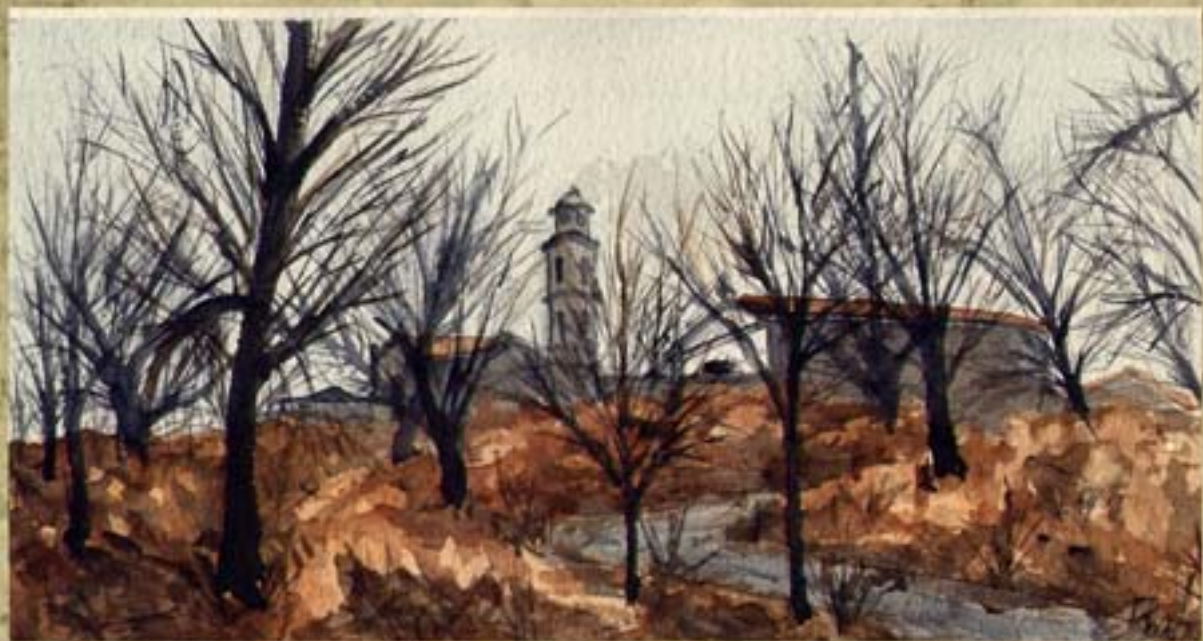
L'église de Bastelica (Corse). Aquarelle sur papier blanc 1986